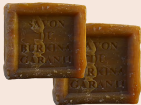
2 boules de savon solide