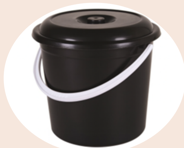
1 petit seau de 5 litre