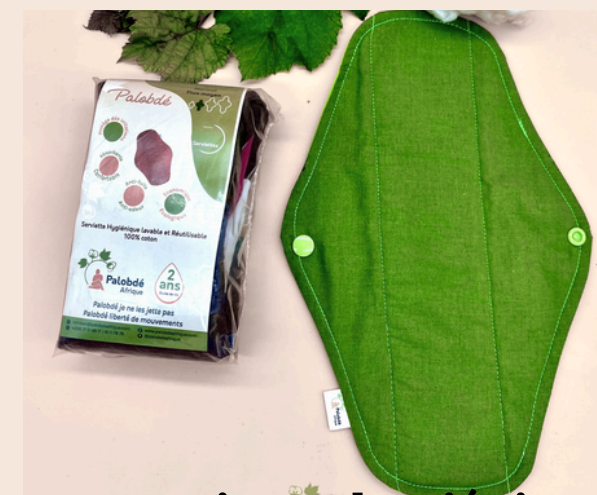
4 serviettes hygiéniques réutilisables