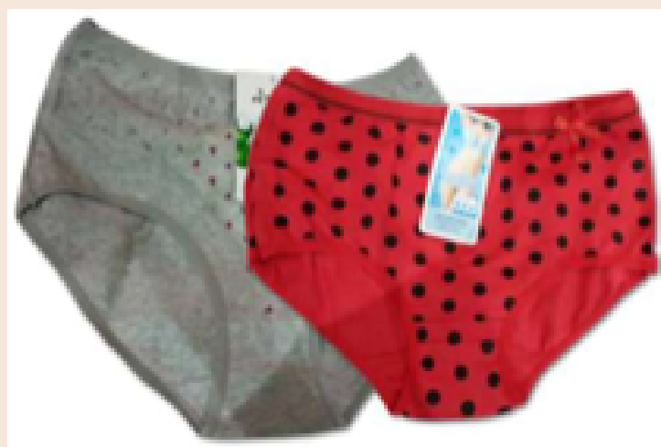
2 sous-vêtements en coton