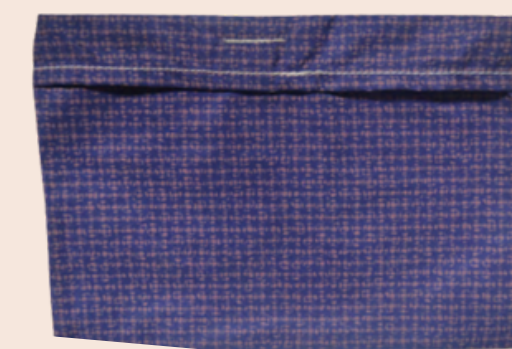
Une pochette de rangement des serviettes hygiéniques