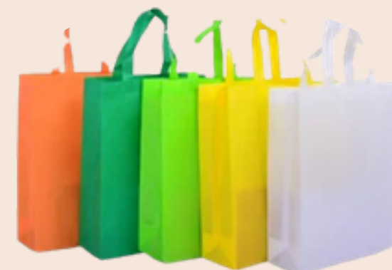
1 sac pour emballage du kit